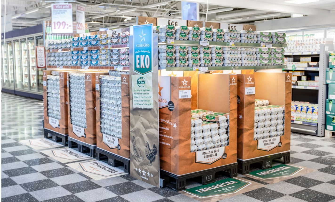
ICA Kvantum Falkenberg är en av butikerna som valt att satsa på Stjärnäggs nya koncept.