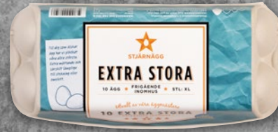
10-PACK EXTRA STORA ÄGG