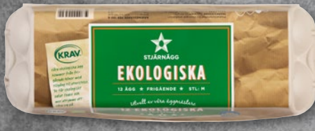
12-PACK EKOLOGISKA ÄGG