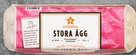
12-PACK STORA ÄGG