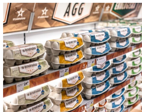
Tydlig indelning av äggavdelningen gör det enklare för shoppers.

- För konsumenten finns en uppsjö av valmöjligheter; ekologiska, ursprungsmärkta, frigående ute eller inne, storleken på ägget, ägg med gula re gula osv. Därför har tydlighet varit en ledstjärna i arbetet med de nya förpackningarna, fortsätter Jörgen.