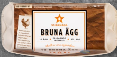
10-PACK BRUNA ÄGG