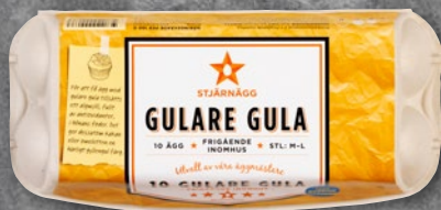
10-PACK GULARE GULA