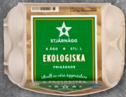
6-PACK EKOLOGISKA ÄGG